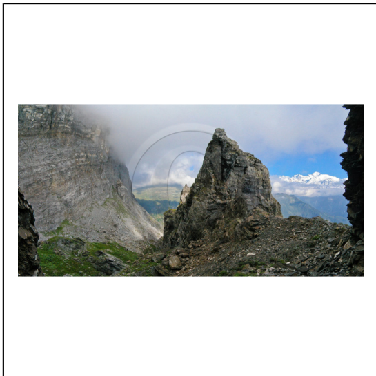
Haute-Savoie, 74, Réserve naturelle de Passy, Le passage du Dérochoir et le Mont-Blanc // Haute-Savoie, 74, Passy nature reserve, The passage of Dérochoir and the Mont-Blanc