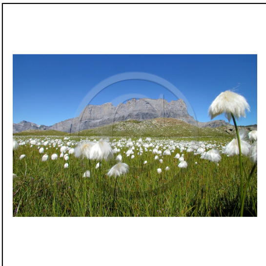
Haute-Savoie, 74, Réserve naturelle de Passy, Linaigrette de Scheuchzer ( Eriophorum scheuchzeri ) et la chaîne des Fiz // Haute-Savoie, 74, Nature Reserve Passy, Scheuchzer cotton grass ( Eriophorum scheuchzeri ) and Fiz mountains