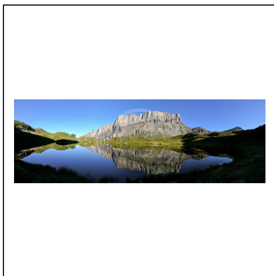
Haute-Savoie, 74, Réserve naturelle de Passy, Lac de Pormenaz et la chaîne des Fiz // Haute-Savoie, 74, Nature Reserve Passy, Pormenaz lake and Fiz mountain