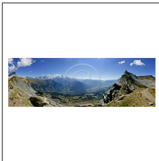
Haute-Savoie, 74, Réserve naturelle de Passy, Le passage du Dérochoir et le Mont-Blanc // Haute-Savoie, 74, Passy nature reserve, The passage of Dérochoir and the Mont-Blanc