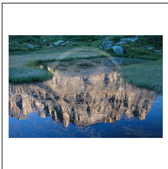
Haute-Savoie, 74, Réserve naturelle de Passy, Lac de Pormenaz et la chaîne des Fiz // Haute-Savoie, 74, Nature Reserve Passy, Pormenaz lake and Fiz mountain