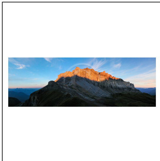
Haute-Savoie, 74, Réserve naturelle de Passy, la chaîne des Fiz // Haute-Savoie, 74, Passy nature reserve, Fiz mountains