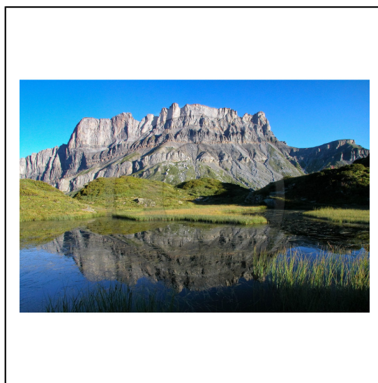
Haute-Savoie, 74, Réserve naturelle de Passy, Lac de Pormenaz et la chaîne des Fiz // Haute-Savoie, 74, Nature Reserve Passy, Pormenaz lake and Fiz mountain